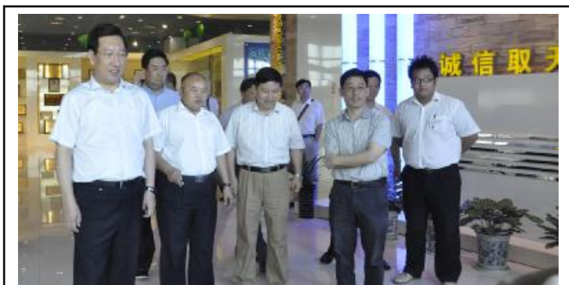
图片新闻 9月16日,呼伦贝尔市党政代表团参观合肥格力。